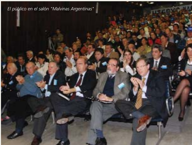
El público en el salón "Malvinas Argentinas"

EL MINISTRO TOMADA EXPRESÓ, TAMBIÉN, QUE "EL MERCADO LABORAL TERMINA DISCRIMINANDO A AQUELLOS QUE NO TIENEN CAPACITACIÓN, A LOS QUE NO TIENEN EXPERIENCIA".