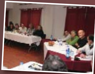
Bonjour en Zona Norte