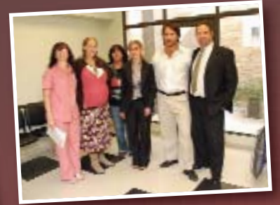
Presentes en la Inauguración del Mamógrafo en OSPEDYC