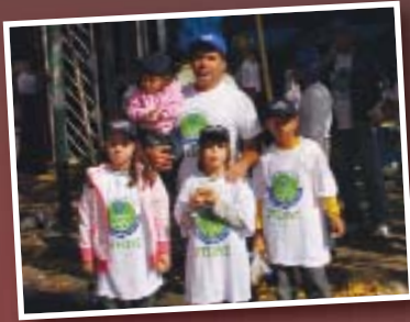
Afiliado junto a su familia