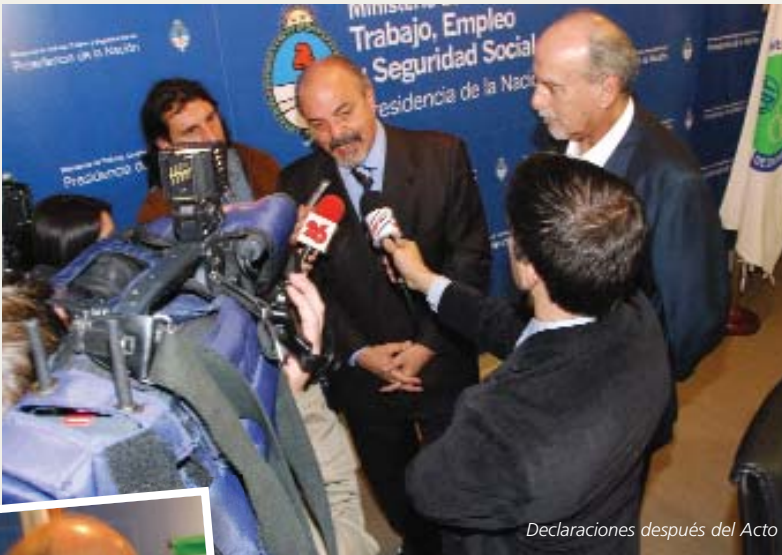
Declaraciones después del Acto