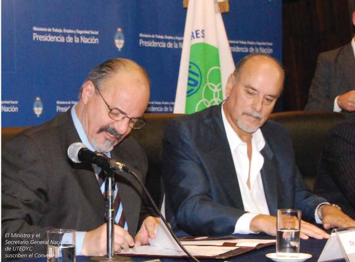
El Ministro y el Secretario General Nacional de UTEDYC suscriben el Convenio