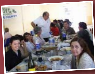
Afiliados en un almuerzo en la seccional Zárate - Campana