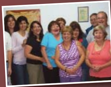
Delegados y Afiliados de la Seccional San Luis