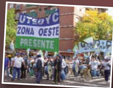
Acto de la CGT