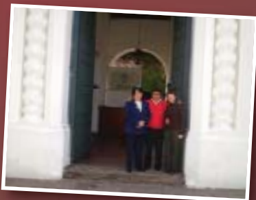
Personal de UTEDYC que cumple su labor en la Casa Histórica