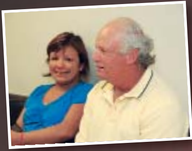
Afiliados en la sala de espera de los consultorios de OSPEDYC