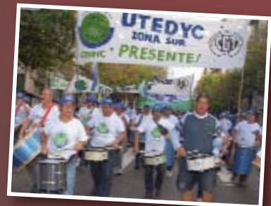
Acto de la CGT