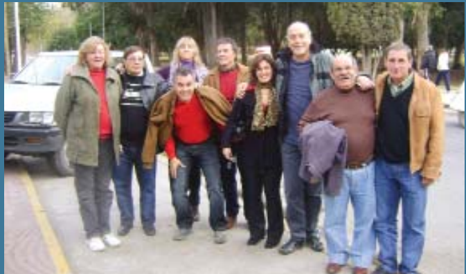
En la sede de UTEDYC, en Necochea

Si bien las visitas a las Seccionales y a las Delegaciones de todo el país forman parte de la filosofía integradora establecida por la conducción sindical que asumió a fines de 2005, por transitar el gremio un año electoral éstas adquieren singulares características comunicacionales.