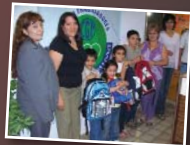
Afiliados en la entrega de mochilas