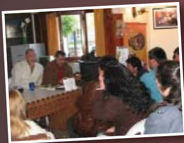
Bonjour en la sede de Villa Gesell