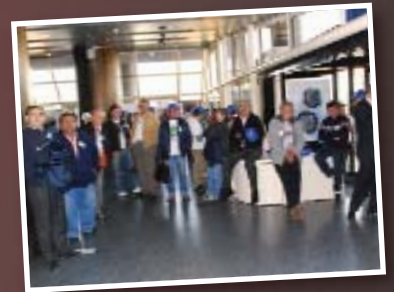
Afiliados en el hall del Ministerio de Trabajo