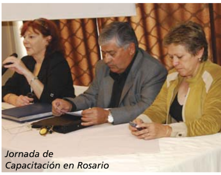
Jornada de Capacitación en Rosario