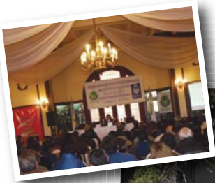
Zona Norte. Jornada de Capacitación.