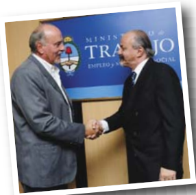
Bonjour y Tomada

Dos son los ejes fundamentales de nuestra labor: uno, el tema de los Convenios Colectivos de Trabajo; y otro, la asistencia a las Seccionales por consultas o situaciones de conflicto.