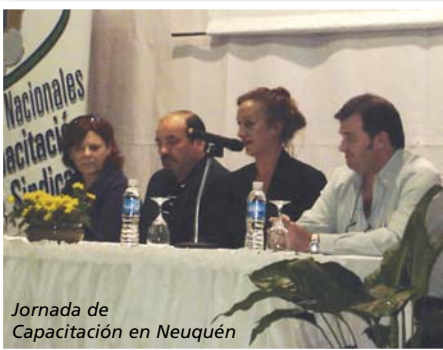
Jornada de Capacitación en Neuquén