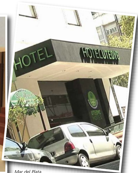
Mar del Plata