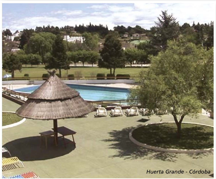
Huerta Grande - Córdoba