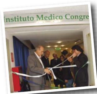
Corte de cinta en inauguración de las salas de internación en la calle Alsina

Otro aspecto en el que se ha venido trabajando de manera conjunta con las diferentes Secretarías para fortalecer la presencia y el control es el de nuestra comunicación institucional con las empresas. Para ello, se diseñó una página Web, con un área específica de contacto de empresas y una suscripción a través de una clave individual de acceso a una cuenta personal, en la que se obtienen todos sus datos e imprimen las boletas de depósito, para optimizar su funcionamiento. Se creó una mesa de