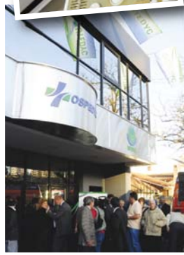
Centro Médico de Lomas de Zamora