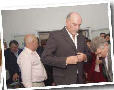
Inauguración del Centro Médico de Córdoba